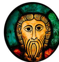
Christ de Wissembourg Première paroisse où Paul fut vicaire

d'Épfig(1998 à 2001). Il retarde sa retraite d'un an, en 2003, afin de mener à bien la restauration intérieure de l'église de Reichsfeld. En 2004, il se retire sur place et continue de rendre de nombreux services pastoraux, dans le cadre de la nouvelle communauté de paroisses. Connue depuis de longues années bien au-delà du cercle de ses paroisses en raison de son ferme engagement en faveur de l'alimentation macrobiotique, il pratique assidûment la marche à pied dans le massif vosgien. C'est au cours d'une promenade qu'il disparaît, le samedi 17 novembre 2018. Les recherches officielles, restées infructueuses, sont abandonnées. Grâce à une battue de bénévoles, organisée par le Monsieur le maire de Reichsfeld, son corps est retrouvé dans l'après-midi du 24 novembre. Ses obsèques sont célébrées le samedi suivant 1 er décembre dans l'église de Dambach-la-Ville, suivies de l'inhumation sur place.