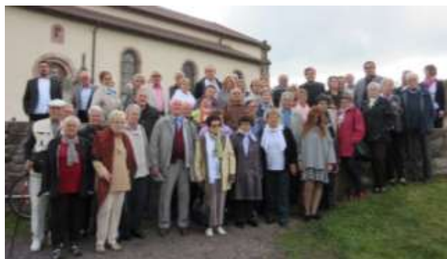
Les choristes se rencontreront en 2016 à Andlau.

Les choristes se sont retrouvés dans la salle des fêtes de La Chapelle-devant-Bruyères pour un repas lors duquel il a été question de fraternité, d'amitié, de partage, avant de chanter tour à tour. Patrimoine oblige, ils ont écouté l'histoire d'une tête d'ours qui ressemble étrangement à celle de l'ours d'Andlau !